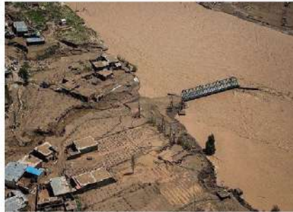
نمایی از سیلاب های ابتدای سال ۱۳۹۸

هرچند وقوع سیلاب پدیده ای طبیعی است که البته دخالت های انسان، شدت و قدرت تخریبی آن را افزایش می دهد، اما با داشتن « آمادگی مناسب » جهت مواجهه صحیح با سیلاب، می توان از میزان این خسارت تا حد زیادی کاست. بخش مهمی از این آمادگی، از طریق آموزش (افزایش سطح آگاهی و نیز مهارت ) افراد بدست می آید و نوجوانان چه در جایگاه امروزشان و چه در نقش های اجتماعی آینده شان، در کانون این آموزش ها قرار دارند.